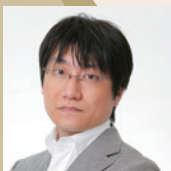
山下 康介 (作曲家)