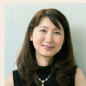
高橋 多佳子 (ピアニスト)