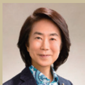
渡辺 俊幸 (審査員長/作曲家)