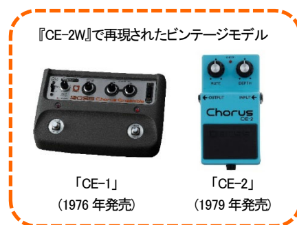
『CE-2W』で再現されたビンテージモデル