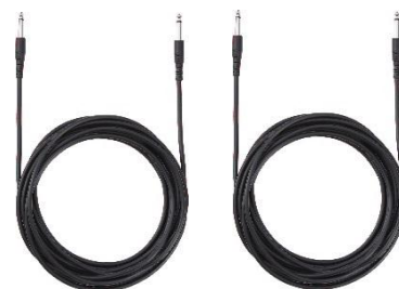
「CUBE Street EX」2台を接続する ステレオ・リンクケーブル