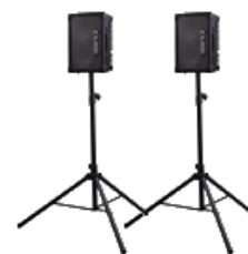
スピーカー・スタンド「ST-A95」（別売）への設置イメージ