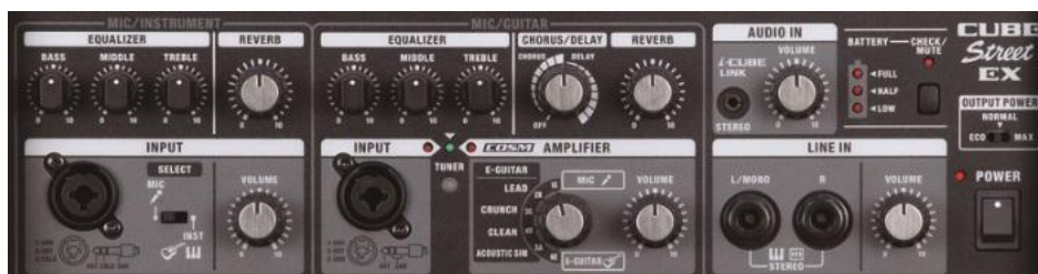
コントロール・パネル

それぞれの「CUBE Street EX」には、XLR対応のマイク入力端子や、キーボードなどの入力に対応したライン・イン端子など、4系統の入力とAUX INを装備しており、2台あわせて最大8系統の入力が可能です。エレキ・ギターの演奏には、3種類のアンプ・タイプ（CLEAN、CRUNCH、LEAD）を搭載。透感のあるクリーンなサウンドから、ハードな歪み（ひずみ）まで表現できます。