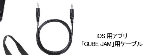
iOS用アプリ 「CUBE JAM」用ケーブル