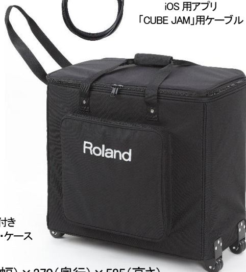
キャスター付き 専用キャリング・ケース