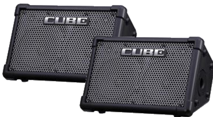
『CUBE Street EX PA Pack』

ローランド（株）（社長：三木 純一 http://www.roland.co.jp/ ）は、電源の確保が難しいストリートでの演奏や小規模なPAセットで大音量を出したいというニーズに向け、電池駆動ながらハイ・パワーのステレオ・アンプ「CUBE Street EX」を2台セットにした合計8入力のコンパクトなステレオPA『Cube Street EX PA Pack』を、2016年4月下旬から発売します。