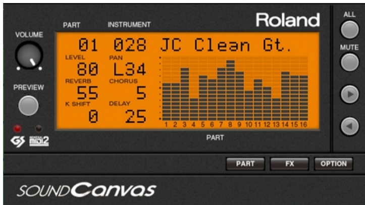
ソフトウェア音源『SOUND Canvas VA』メイン画面