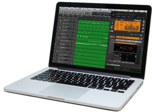
『SOUND Canvas VA』の使用イメージ

コンピューターを使った音楽制作は、昨今ではソフトウェアのみで行うことも珍しくありませんが、80年代後半から90年代にかけてはハードウェアを組み合わせるスタイルがほとんどでした。当時、当社のハードウェア「SOUND Canvas」シリーズは、音色バランスが良く、データの互換性が高いため、デファクトスタンダード音源として、音楽制作を楽しむ多くの方にご愛用いただきました。現在でもゲーム音楽やカラオケデータ、楽曲制作で使用されることが多く、コンピューターを使った音楽制作で使いやすいソフトウェア化の要望が寄せられてきました。