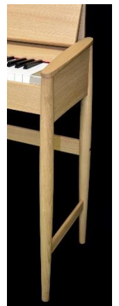
細身の脚 （ピュアオーク）