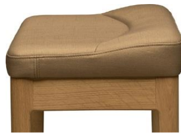
専用のピアノいす

人間工学に基づいた「座り心地」を徹底的に研究するカリモク家具のノウハウを活かした専用ピアノいすも付属しています。超高密度ウレタンを使用により、ピアノ演奏時に座面にかかる体圧を分散することで反発力を軽減。また、座骨を起す座面形状により、腰椎部の負担を軽減し、長時間でも快適にピアノを演奏いただけます。