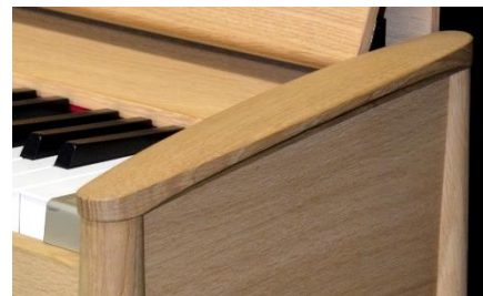
鍵盤サイドのアームトップ（ピュアオーク）

『きよら KF-10』のキャビネットは、カリモク家具のインハウス・デザイナーによってデザインされました。従来のデジタルピアノに用いられてきた塩化ビニール仕上げとは異なり、天然木だからこそ実現できるやわらかな曲線美はインテリアと調和し、細身の脚で仕上げた軽快なデザインは空間を広く見せる効果があります。また、鍵盤両側のアームトップは、ソファの肘掛けをイメージしており、触り心地の良さまで追求。鍵盤ふたを開けると二つ折りになる譜面台など、シンプルな設計でインテリアになじむ仕上がりになっています。優しい肌触りの木肌、美しい木目など、キャビネットの一台一台が異なった表情を見せ、『きよら KF-10』は、長く使い込むほど愛着のある風合いへ変化します。