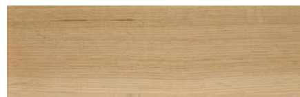
木目の例（ピュアオーク）