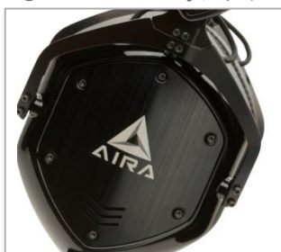
AIRA ロゴのイヤースールド