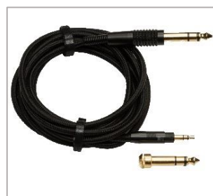
ストレートケーブル