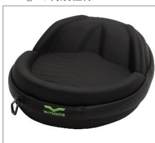
ラージサイズ キャリングケース